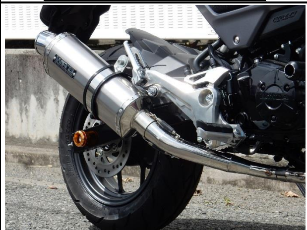
ステンレス/チタンオーバル(ソリッド)