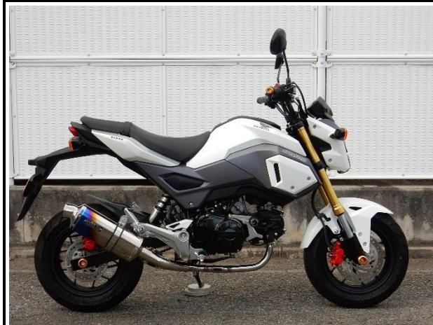
ステンレス/チタンオーバル(焼き色)