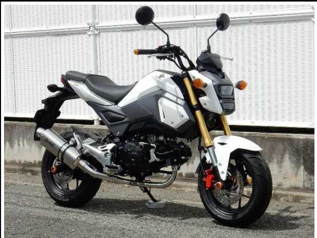
ステンレス/チタンオーバル(ソリッド)