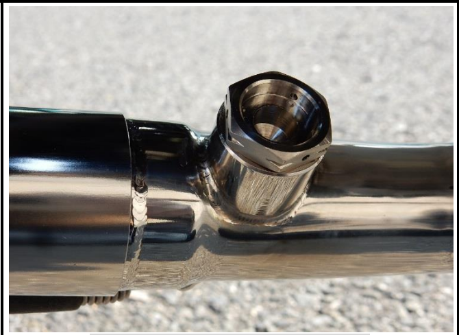
オプションセンサーボス取り付け例