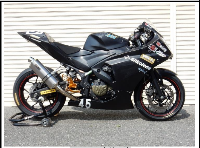
マフラー全体写真