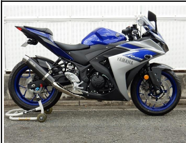
ステンレス/カーボン