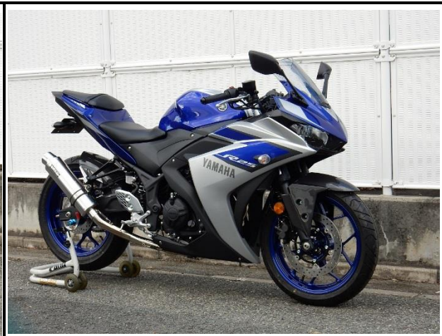
ステンレス/ステンレス