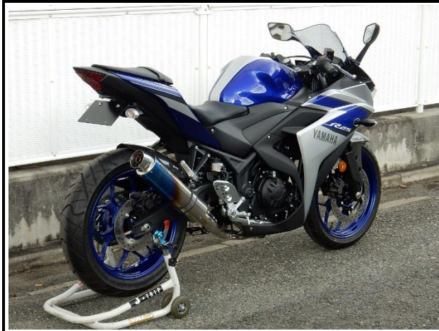
ステンレス/焼き色チタン