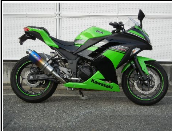
ステンレス/チタンオーバル(焼き色タイプ)