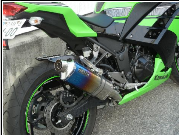
ステンレス/チタンオーバル(焼き色)