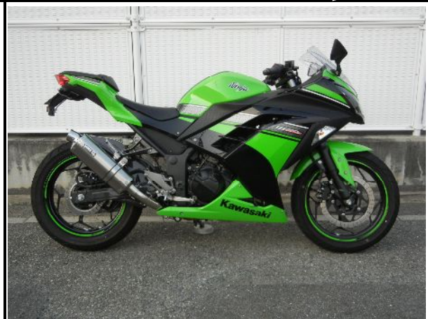
ステンレス/チタンオーバル(ソリッド)