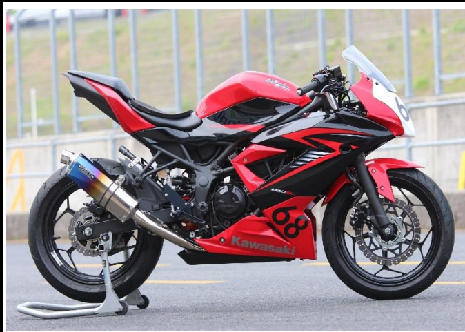
マフラー装着例。写真は焼き色サイレンサータイプ