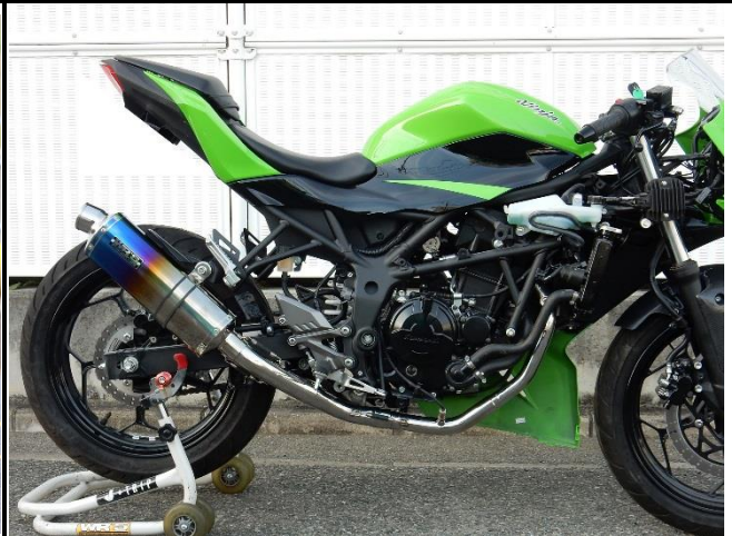
マフラー全体写真