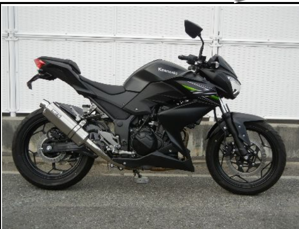
ステンレス/チタンオーバル(ソリッド)