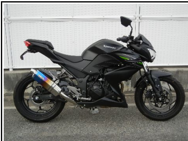
ステンレス/チタンオーバル(焼き色タイプ)