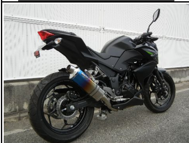
ステンレス/チタンオーバル(焼き色)